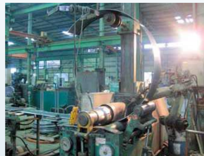
推進管カラー製作状況