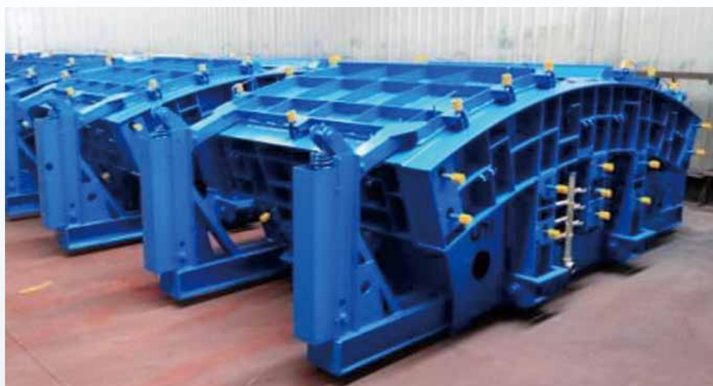
RCセグメント型枠 (杭州鉄牛機械有限公司)

確かな品質が実証されたアジアにおける様々なトップメーカーと業務提携し、これまで蓄積されたノウハウを軸に設計・製造・納品に至るまで万全の体制で対応を致します。