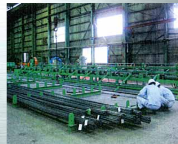
PC鋼棒の切断・加工 (日本)