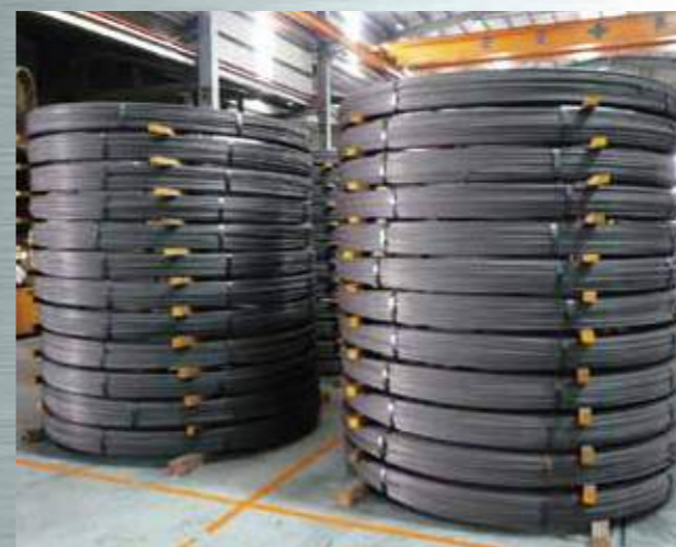
PC鋼棒 JIS G 3137取得