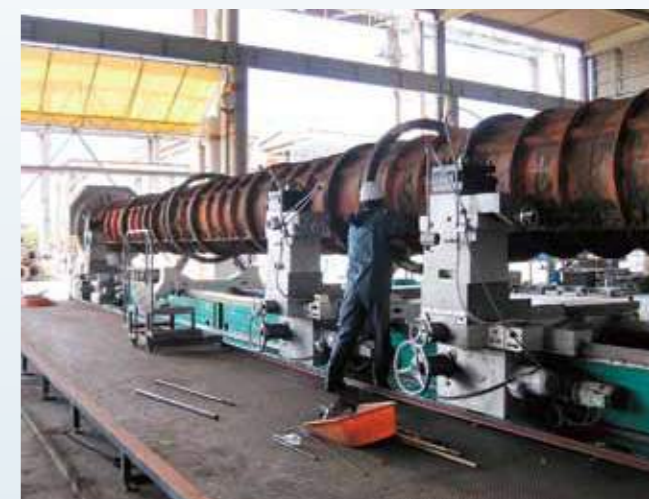
長尺旋盤 タイヤ切削中