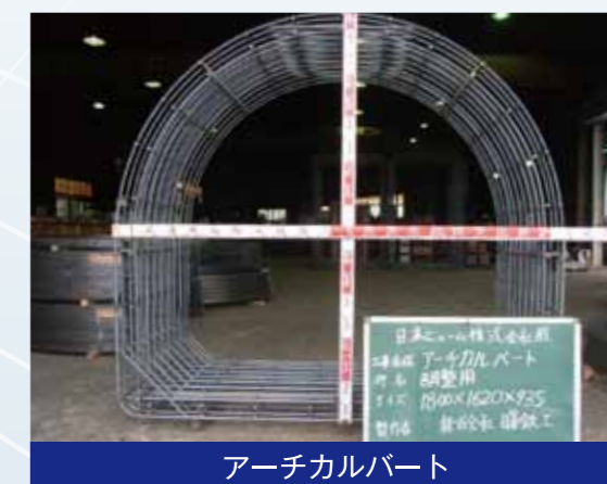
アーチカルバート