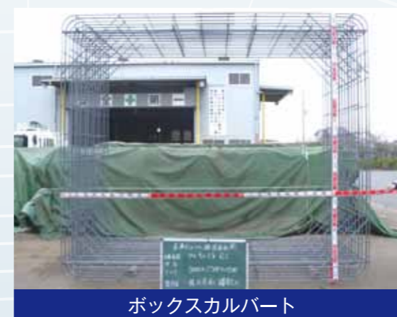
ボックスカルバート