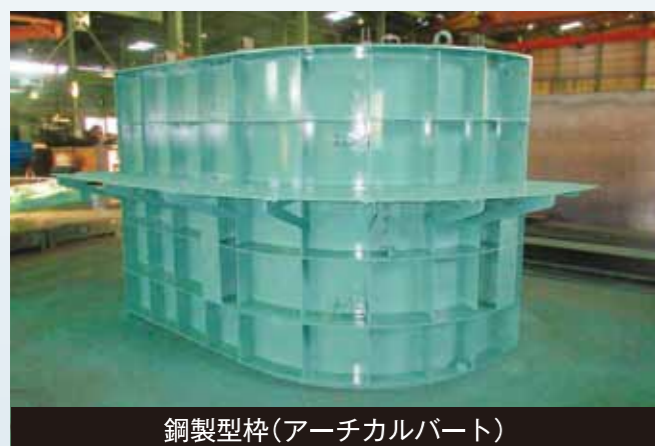
鋼製型枠(アーチカルバート)